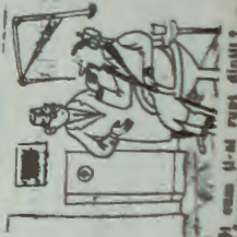
— Păi cum și-ai rupt dinții? — Începușterul se săltană pentru la față și să corbănată, are în jurul lui de 20 decembrie.